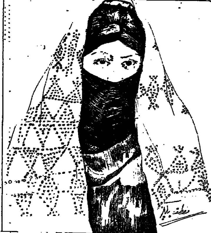
حسنا من جنوب سيناء بريشة مصطفى بكير - فنان من سيناء

لنسى ثمة شك في أن الحياة والنواها المختلفة، وصورها الرائعة، هي مادة الفنان .. ولكن الفنان يحتاج لحافز معين يمكنه من الأشراف على الحياة والتأمل فيها واستخلاص غواصها، وتبثيل الظواهر الروائية وما يكتبها من غواص وأسرار في حلة فائقة من جمال ..